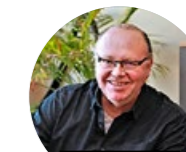
TOPHINKE AUTOMATION & GEBÄUDETECHNIK AG

Auf den Lehrbeginn 2021 suchen wir wieder interessierte Personen für folgende Berufe: Gärtner/innen EFZ in den Fachrichtungen Baumschule und Stauden, EBA-Pflanzenproduzent/innen, Detailfachhandel Garten EFZ und EBA sowie Floristik EFZ und EBA.