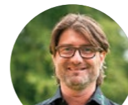
GÖLDI AG GARTEN- UND SPORTPLATZBAU