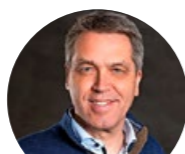
KÖHLER AG PAPETERIE-BÜROBEDARF

Der Sune-Egge ist ein Fachspital für Sozialmedizin und Abhängigkeitserkrankungen mit kantonalem Leistungsauftrag. Unsere Patienten sind Erwachsene aus dem Sucht- und Obdachlosenmilieu. Auf Lehrbeginn 2021 haben wir drei Ausbildungsplätze Fachfrau/Fachmann Gesundheit (FaGe) zu vergeben.