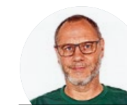
YASIFLOR GMBH GARTENBAU + SCHWIMMTEICHBAU

Bei uns erlernt man alle Arbeiten, die mit Blumen und Pflanzen zu tun haben. Wir gestalten Sträuße, Gestecke, Dekorationen sowie Hochzeitsschmuck und Blumenkreationen für Beerdigungen. Auf Lehrbeginn 2021 bieten wir eine Lehrstelle als Florist/in EFZ an.