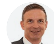
EWD ELEKTROINSTALLATIONEN DAVOS AG

Wir sind ein Wechselflor- und Schnittblumenproduzent mit Gärtnerei und Blumenladen. Als wertvoller Beitrag für die Zukunft junger Menschen stellen wir seit Generationen Lernende ein. Auf August 2021 haben wir eine Lehrstelle als Zierpflanzengärtner/in EFZ zu vergeben.