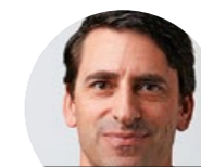
KREBSER AG PAPETERIE- UND BÜROBEDARF

Wir sind ein kleineres KMU mit 13 Mitarbeiter/innen. Wir führen vor allem kleinere Aufträge aus und haben daher sehr engen Kontakt mit unseren Kunden und Kundinnen. Ab Herbst 2021 bieten wir eine Lehrstelle als Montage-Elektriker EFZ oder Elektroinstallateur EFZ an.