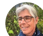
FLUORS ED ORTICULTURA MALGIARITTA

Das 1857 gegründete Familienunternehmen beliefert Firmen und Institutionen, Schulen sowie Private in den Bereichen Verbrauchsmaterial. Ab Herbst 2021 suchen wir zwei motivierte junge Persönlichkeiten für eine Ausbildung im Bereich Detailhandel mit Schwerpunkt Beratung in Thun.