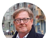
SOZIALWERK PFARRER SIEBER (SWS)

Die Teppich Quelle AG steht für optimale Boden- und Innendekorationen. Auf Lehrbeginn 2021 sind wir auf der Suche nach einem Lehrling Boden-/Parkettleger EFZ textile und elastische Beläge, und aktuell suchen wir Lehrling Boden-/Parkettleger EFZ Fachrichtung Textil und Parkett.