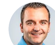
STIERLI SOLAR GMBH INSTALLATIONS- UNTERNEHMUNG

Wir sind ein Ingenieurbüro im Bereich der Energie- und Haustechnikplanung und feiern in diesem Jahr unser 40-jähriges Bestehen. Wir legen seit der Gründung Wert auf die Aus- und Weiterbildung. Ab Herbst 2021 bieten wir eine Lehrstelle als Gebäudetechnikplaner Heizung oder Lüftung.