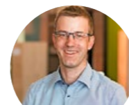
PFISTER PROFESSIONAL AG INNENEINRICHTUNG

Tophinke ist seit über 50 Jahren ein schweizerweit führender Anbieter für automatisierte Gesamtlösungen, Elektroinstallationen und Schaltschränke. Wir bieten ab Lehrbeginn 2021 jeweils einen Lehrplatz als Elektroinstallateur/in EFZ und Automatikmonteur/in EFZ an.