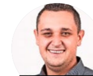
CAVIEZEL AG ELEKTROTECHNISCHE ANLAGEN

Die Silac AG ist spezialisiert auf Entwicklung, Konstruktion und Bau von Werkzeugen, Herstellung, Veredelung und Montage von Kunststoffspritzguss- und Duroplastteilen. Auf Lehrbeginn 2021 bieten wir interessierten jungen Menschen eine Lehrstelle als Kunststofftechnologe/in EFZ an.