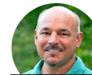
HAUENSTEIN AG GARTENCENTER, BAUMSCHULE

Wir arbeiten in den Bereichen Elektroinstallationen, Telematik und Gebäudetechnik. Unser Unternehmen ist in Davos und Umgebung verankert. Ab Herbst 2021 bieten wir folgende Lehrstellen an: Elektroinstallateur/in EFZ sowie Montage-Elektriker/in.