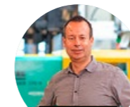
SILAC AG KUNSTSTOFFWERK, WERKZEUGBAU

Unser Unternehmen ist auf den Garten- und Sportplatzbau sowie den Unterhalt von Gartenanlagen und Sportplätzen spezialisiert. Wir bilden im nächsten Lehrjahr Gärtner/innen Landschafts- und Gartenbau EFZ aus und legen Wert darauf, jungen Menschen einen guten Einstieg ins Berufsleben zu ermöglichen.