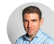
E+H INGENIEURBÜRO FÜR ENERGIE + HAUSTECHNIK AG

Die EWD Elektrizitätswerk Davos AG versorgt seit über 125 Jahren die Gemeinde Davos – rund 15 000 Kunden – im Einzugsgebiet mit Strom über 450 Kilometer Kabel- und Freileitungen. Wir bieten ab Herbst 2021 offene Lehrstellen als Netzelektriker EFZ, Elektroinstallateur EFZ und Kaufmann/-frau EFZ.