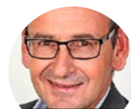
SELNET AG ELEKTRO- INSTALLATIONEN

Elektro Burri ist seit 1982 erfolgreich auf dem Markt. Wir sind ein innovativer, dynamischer Arbeitgeber und Lehrbetrieb. Wir bieten auf Lehrbeginn 2021 zwei Lehrstellen als Elektroinstallateur/in EFZ an. In den letzten Jahren haben wir viele junge Menschen ausbilden dürfen.