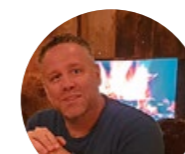
BEAT BÜRGIN ELEKTRO AG

Wir sind eine professionelle Textilreinigung mit einem der modernsten Kassensystemen. Auf Lehrbeginn 2021 bieten wir Lehrstellen im Beruf Fachfrau/Fachmann Textilpflege EFZ an: Es gibt zwei freie Plätze an unserem Standort in Büren, einen in Solothurn und einen in Luzern.