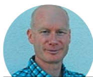
ELEKTRO BURRI PARTNER AG, ELEKTRO- INSTALLATIONEN

Auf Herbst 2021 bieten wir interessierten Berufseinsteiger/innen eine Ausbildung im Detailhandel Beratung an. Mit total elf Geschäften am Zürichsee, im Zürcher Oberland, in der Flughafenregion und der Linthebene betreuen wir Kunden jeden Alters bei Fragen rund ums Büro zu Hause oder im Geschäft.