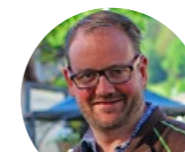
GÄRTNEREI MARTIN EICHENBERGER GARTENBAU

Pfister Professional steht für Inneneinrichtungen im Objektbereich. Auf Lehrbeginn 2021 bieten wir eine Lehrstelle Bodenleger mit Fachrichtung textile und elastische Beläge an. Anforderungen: Real- oder Sekundarschüler/in mit guten Noten sowie handwerklichem Geschick.