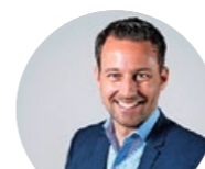
TEXPRESS TEXTILPFLEGE AG

In unserem kleinen und kollegialen Team bieten wir ab Lehrbeginn 2021 eine Lehrstelle Montage-Elektriker/in EFZ oder Elektroinstallateur/in EFZ an. Wir sind spezialisiert auf Photovoltaikanlagen, Batteriespeicher, Ladefrastruktur für Elektrofahrzeuge und vieles mehr.